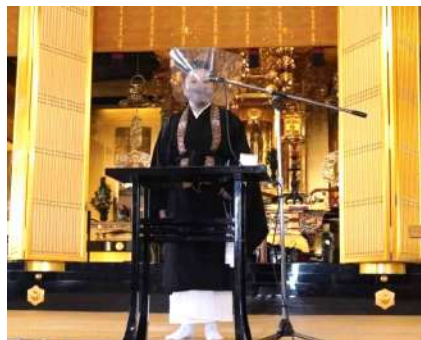
築地本願寺お晨朝法話