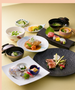
⑪ 6, 600円