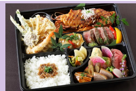
⑥ 7, 500円（オマール海老）