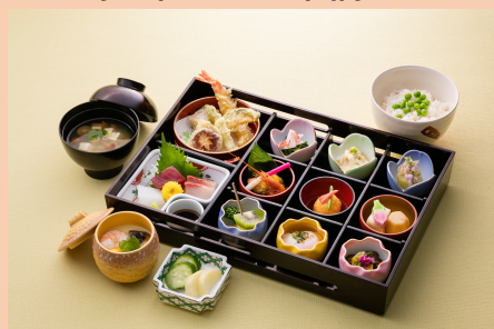
⑨ 3, 750円