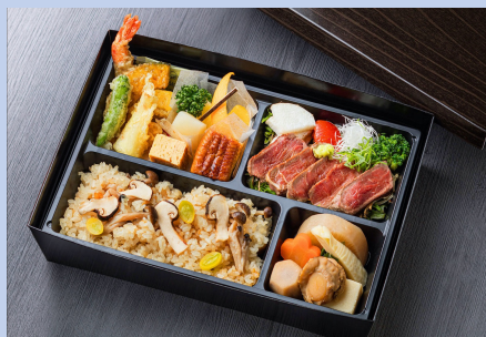
① 3, 240円