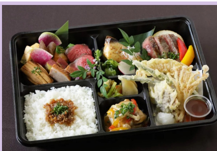
⑤ 5, 000円（肉料理：牛）