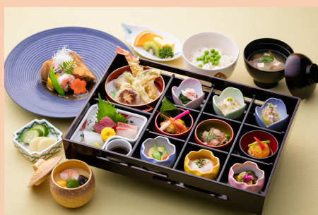
⑩ 5, 500円