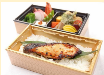
⑦ 2, 200円（銀鱈弁当）