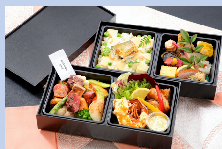
③ 5, 500円