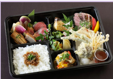
④ 3, 000円（肉料理：豚）