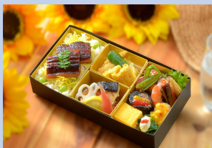
② 3, 800円