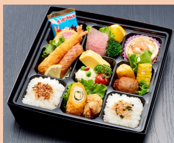
⑫ お子さま用 1, 650円